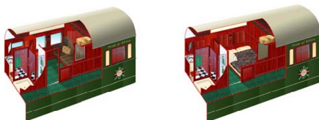
Exempel Pullman kupé

Det finns tre klasser på tåget, den mista kupén kallas Pullman och mäter 7 kvadratmeter, nästa är Deluxe med 11 kvadrat och den största, Royal , har 16 kvadratmeter. Vi har totalt 9 pullman kupeer och 6 deluxe kupeer ombord. Royal får vi göra mot förfrågan.